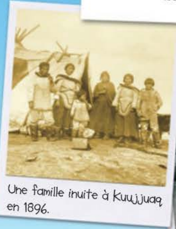
Une famille inuite à Kuujuaq en 1896.