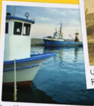
Les Micmacs pêchent aujourd'hui sur des bateaux modernes.