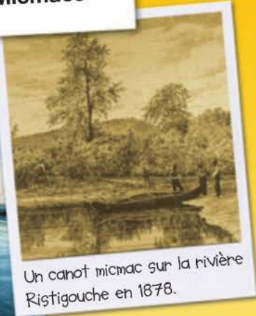
Un canot micmac sur la rivière Ristigouche en 1878.