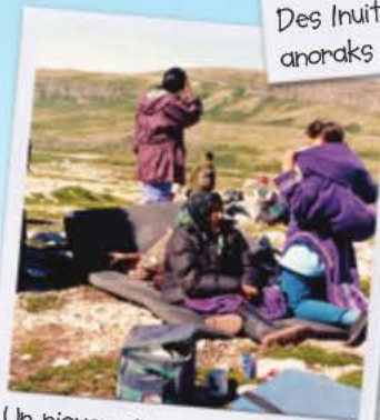
Un pique-nique inuit dans une région isolée du Grand Nord.