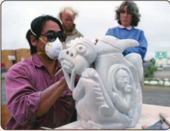
La grande popularité de leurs sculptures permet à beaucoup d'Inuits de vivre de leur art.

Les peuples micmac et inuit vivent tous les deux de grandes difficultés économiques. L'Arctique est très peu développé sur le plan économique et on y trouve peu d'emplois. Dans les réserves micmaques, il n'y a pratiquement aucun employeur. Les Micmacs doivent le plus souvent se résoudre à accepter des emplois saisonniers à bas salaire. Le chômage est aussi important dans les réserves micmaques que dans les villages inuits. Le niveau d'instruction des deux peuples est moins élevé que la moyenne canadienne. Beaucoup de Micmacs et d'Inuits ne terminent pas leurs études secondaires; ils n'ont donc pas accès aux emplois payants. Il existe une grande pauvreté dans les villages inuits et les réserves micmaques.