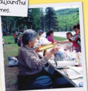
Un pique-nique micmac en Gaspésie.