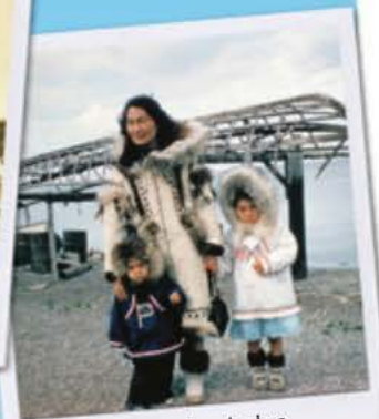
Des Inuits portant des anoraks garnis de fourrure.