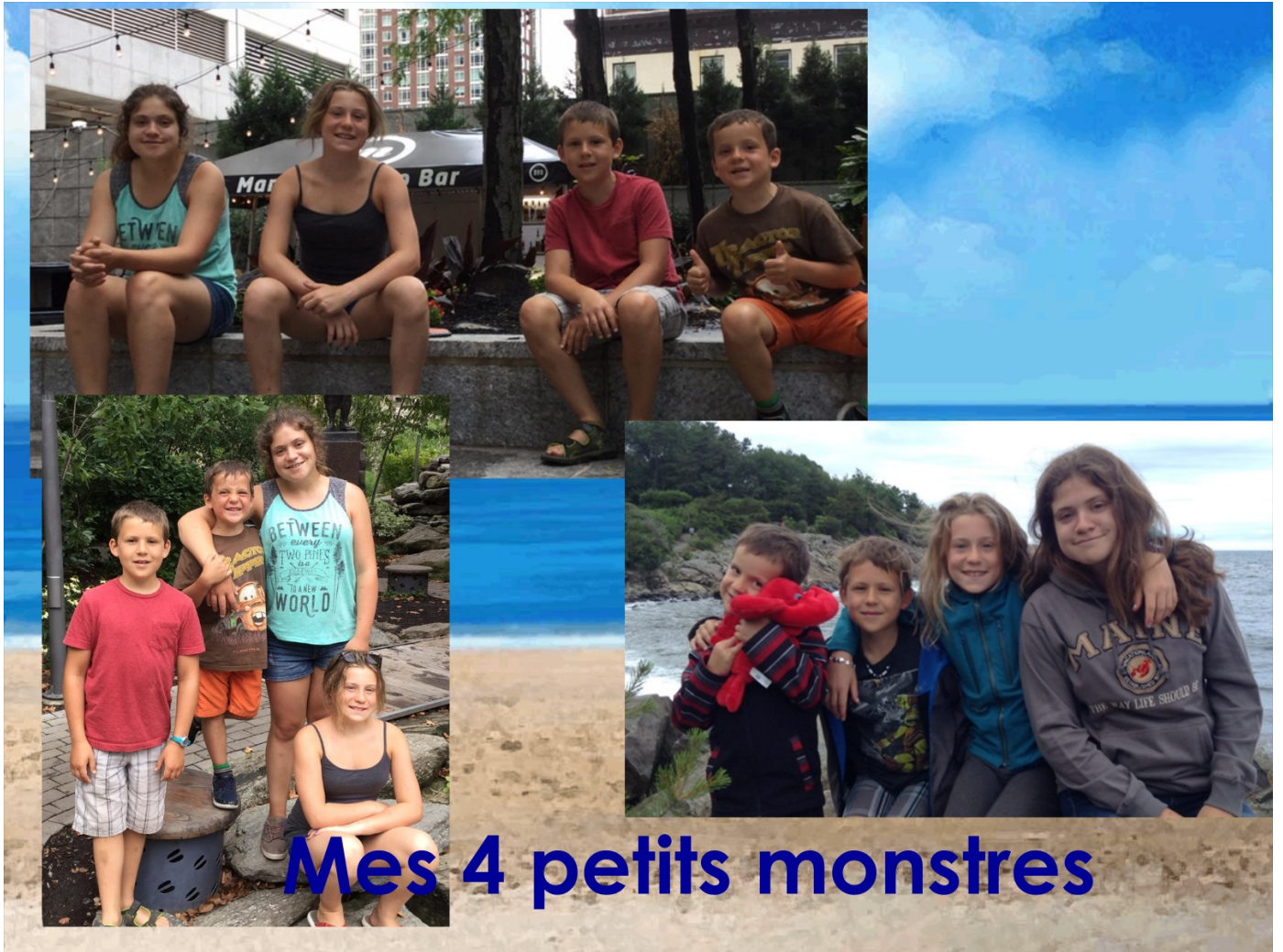
Mes 4 petits monstres